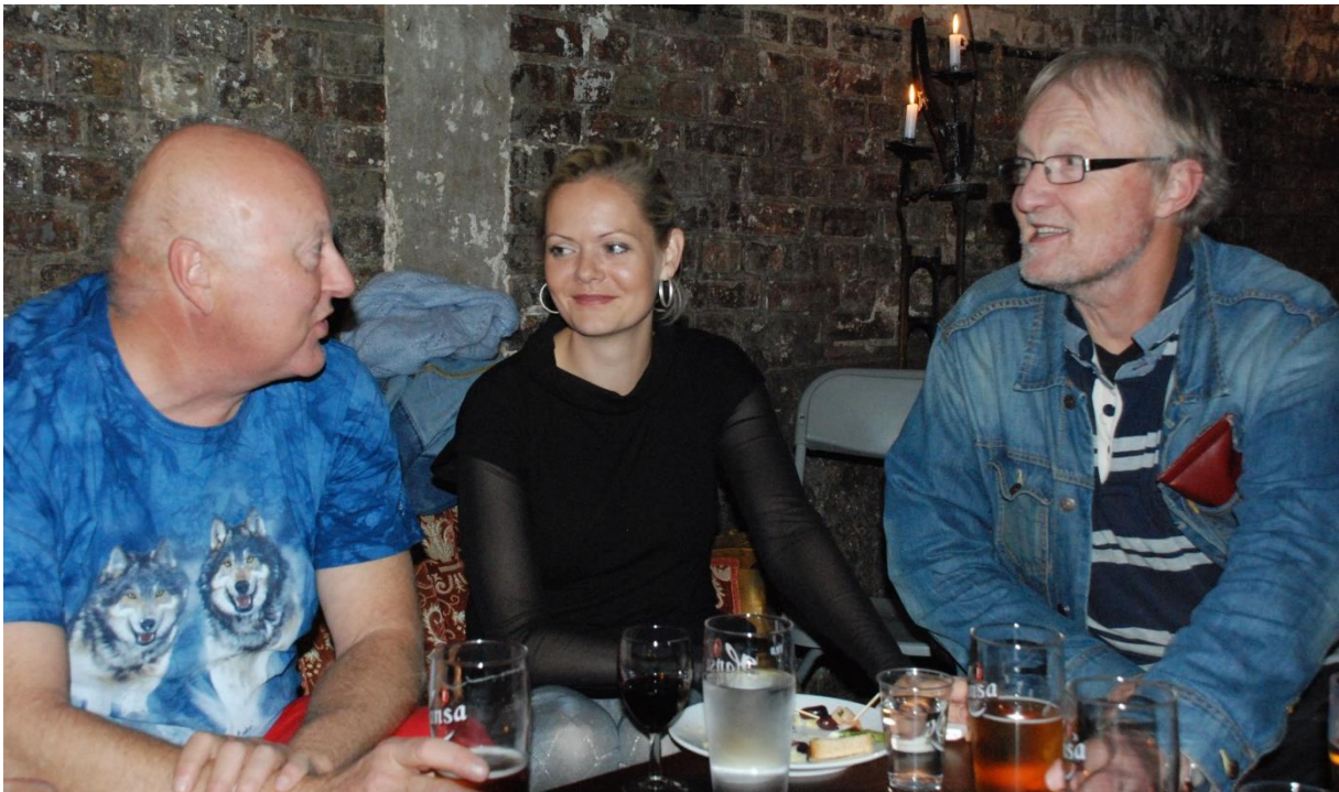
Fra sosial aften på Månefisken ved Akerselva.

20.45: Fingermat, tid for samtaler og samvær.