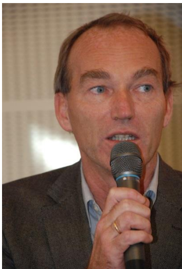
Thomas Hylland Eriksen, ordstyrer i siste sesjon.

I årets siste sesjon møtte vi fire inviterte innledere i en panelsamtale, ledet av Thomas Hylland Eriksen, professor i sosialantropologi, Universitetet i Oslo. Ønsket var å gjennomføre en avslutningsdebatt som samlet noen tråder, etter tre dager om tilgang til talerstoler, stemmer som slår igjennom og stille stemmer, som vi kanskje burde lytte mer til?