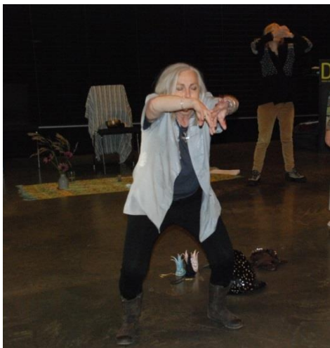
Fra verksted 2. Røstkraft , med Marie Bergman

Marie er artist, sanger og komponist, blant Skandinavias mest markante stemmer, med en særegen kraft og nærhet innen ulike sjangrer. Men i stadig større grad har hun også gjort seg gjeldende med undervisning og forelesninger om musikk, helse og livskraft: stemmen i et helhetsperspektiv. "På ett både humoristisk, praktisk, omtumlande och förbluffande enkelt vis lyfter vi röstkraften och gör rösten till vår bästa allierade och följeslagare!