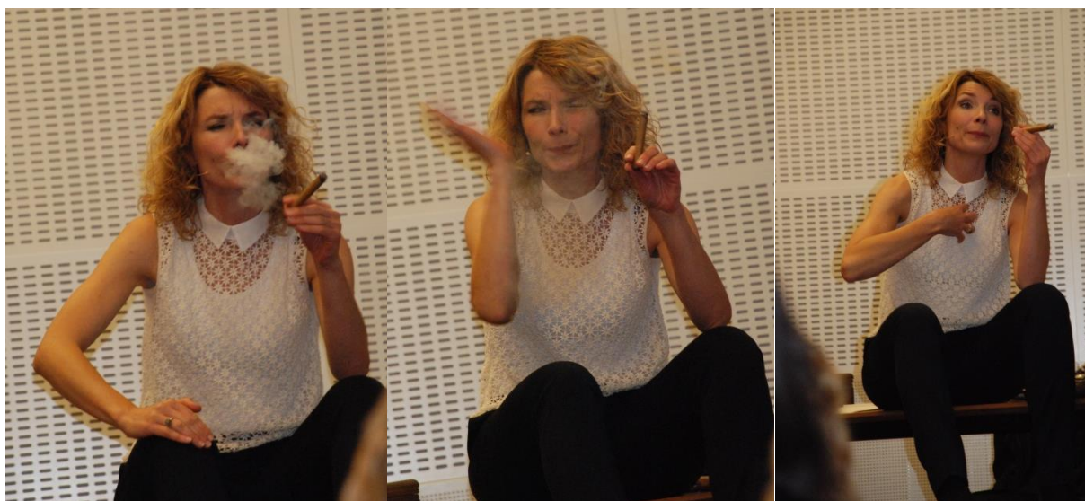
Røyken lå lavt, og publikum kom Amalie – og Herborg – tett in på livet i scener fra Jeg trenger å slå med vingene .