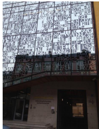
Lærernes Hus skapte med åpne og lyse flater en velegnet ramme, der både konferansesal og cafeen øverst ble benyttet.