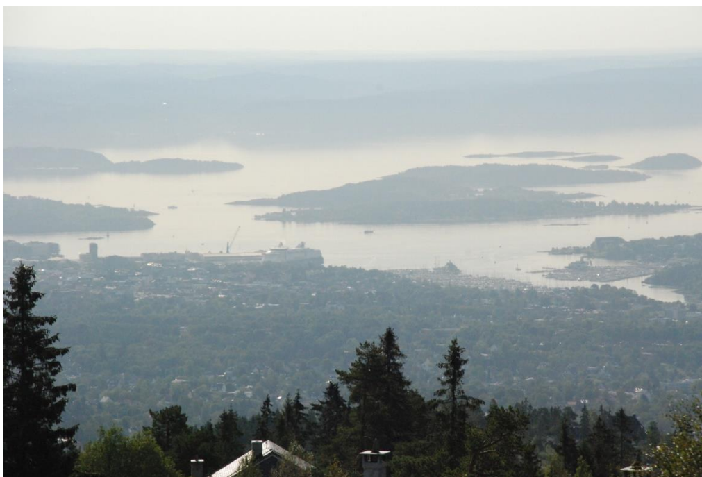
Utsikt fra konferansearena Voksenåsen – vakkert beliggende øverst i Holmenkollen

TVIL2016 har sikret seg Voksenåsen kultursenter i Oslo som arena igjen, dagene 7. – 8. september. Arrangørgruppen omfatter miljøer innen utdanning, helse, rusforebygging, spesialpedagogikk og kulturformidling.